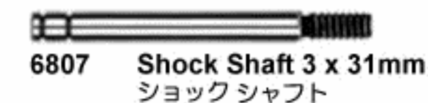
6807 Shock Shaft 3 x 31mm ショックシャフト